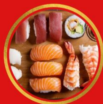
La Cuisine Asiatique

Issue d'une identité commune, la cuisine asiatique reste néanmoins l'une des cultures culinaires les plus riches et variées au monde. Riz (cantonais, fri), nouilles (au blé ou de riz), poisson (cuits ou crus), épices (curry, gingembre...) et herbes aromatiques (coriandre, citronnelle...) sont au coeur des saveurs que l'on retrouve le plus sur le continent. Au menu: Ramen, Curry, Sushis, Bortsch, BoBun... Un régal pour toutes les papilles !