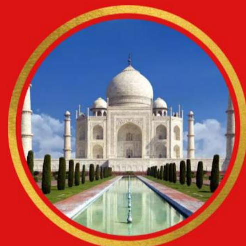
Le Taj-Mahal, Inde