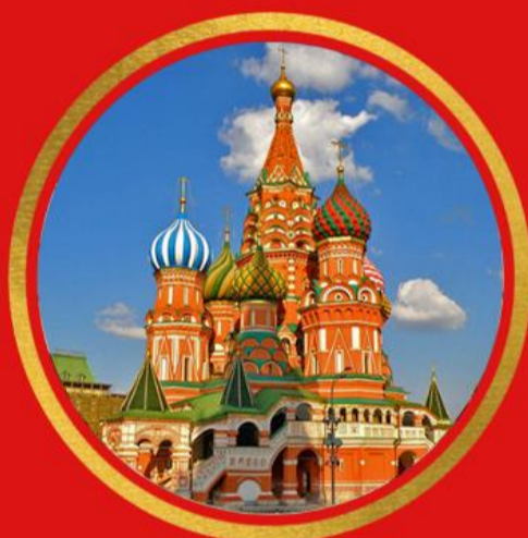
La Cathédrale Basile-Le- Bienheureux, Moscou, Russie