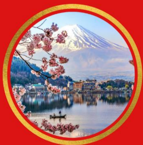
Le Mont Fuji, Japon